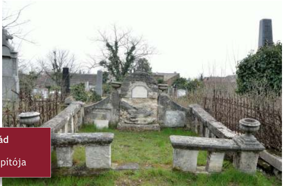
Lovag Czúr család 2-4/16-17-18 Kispest egyik megalapítója